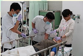
呼吸器シミュレーション学習会